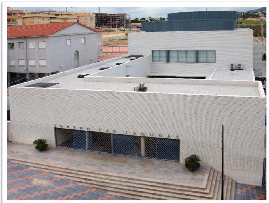
Obra: Teatro de las Lagunas, Mijas Costa